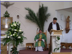
Foto strana 8: 1 Celoslovenské stretnutie SVdP v Leviciach, 2. Adventná kapustnica BA, 3 - 4 Adventné vence , 5 Projekt Orange Vianoce 2012 nákup potravín pre Šurany

Foto na obálke: Posviacka adventných vencov a Betlehem v kostole sv. Michala v Leviciach, Vianoce v SC Šurany, Adventná kapustnica v Bratislave.