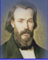
bl. Frederik Ozanim 1813-1853