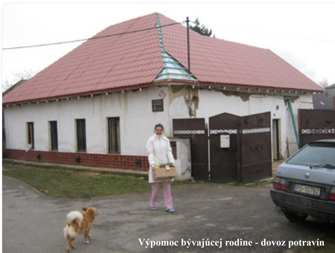
Výpomoc bývajúcej rodine - dovoz potravín