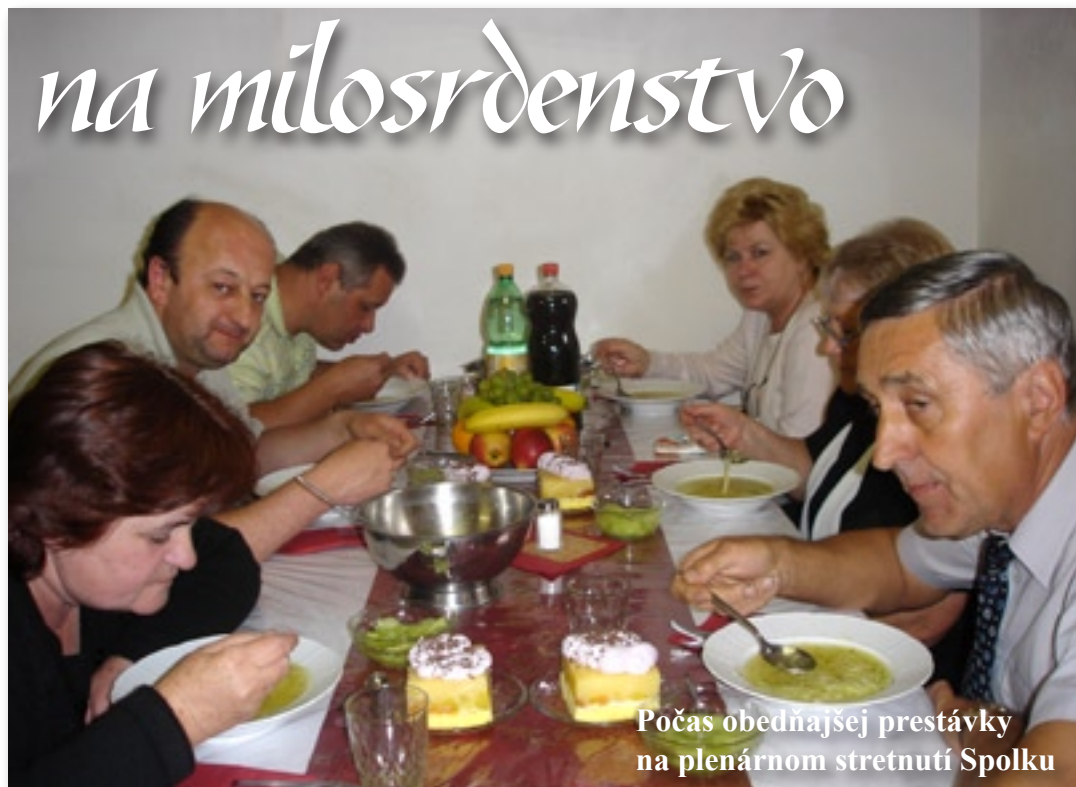
Počas obedňajšej prestávky na plenárnom stretnutí Spolku

Toto sú slová jednej našej členky z konferencie