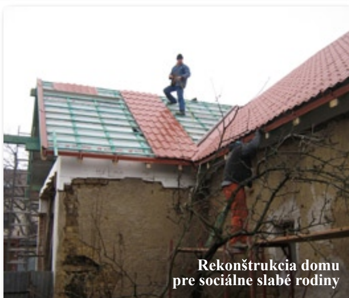
Rekonštrukcia domu pre sociálne slabé rodiny